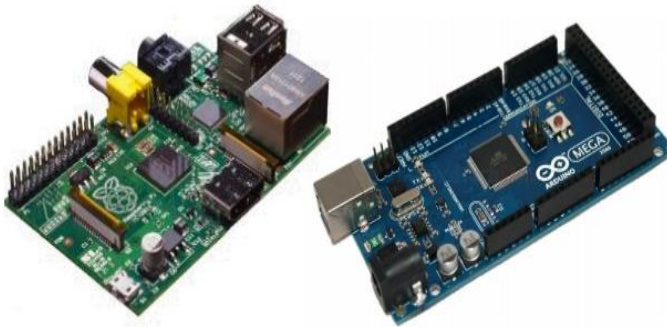
Figura 3. Izquierda: Raspberry Pi - Derecha: Arduino [18]