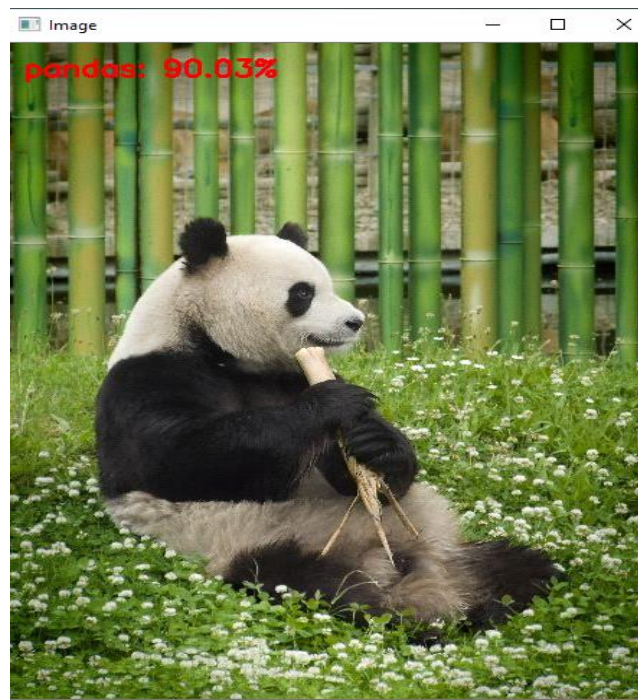
Figura 3. Muestra de resultado – imagen panda.