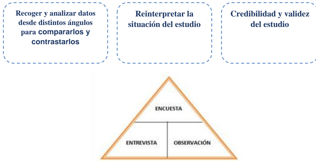
Figura 1. Proceso de Triangulación

datos implica, combinar distintas técnicas de indagación, para lograr hallazgos complementarios y desarrollar el conocimiento relativo a un determinado objeto de estudio; Según Denzin (2000), cuanto mayor es el grado de triangulación, la fiabilidad de las conclusiones alcanzadas se incrementa. Ver figura 1