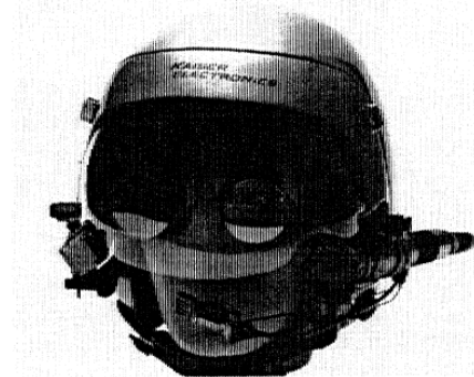
Figure 1. Optical see-through head-mounted display.

Estos espejos se utilizan también para reflejar las imágenes