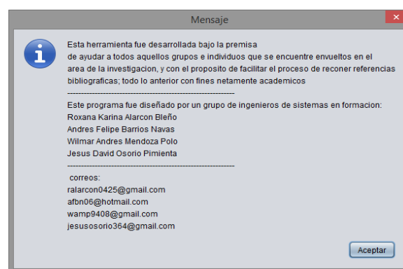
Figura 1. Visual de herramienta al ser ejecutada

A continuación, entre las figuras 1 a la 5 se presentan las visuales de diferentes interacciones con la herramienta, comenzando por la visual inicial que presenta un mensaje de bienvenida (figura 1).