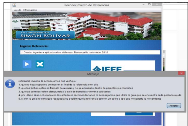
Figura 4. Visual de la herramienta cuando la herramienta no es válida.

Para apoyar la adecuada ejecución de la herramienta para reconocer referencias bibliográficas, se ha elaborado una guía consultada a través del menú ayuda interactiva, y que permite a través de distintas opciones que el usuario navegue por diferentes opciones de tipos de referencias y estilos. La guía cumple tres propósitos: