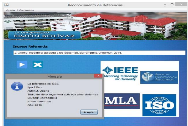
Figura 3. Visual de la herramienta cuando la referencia es válida.