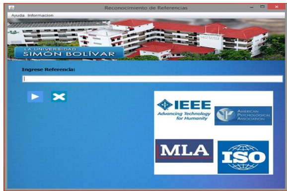
Figura 2. Visual de la herramienta lista para su uso

Tras la interacción la herramienta emitirá dos tipos de respuesta: