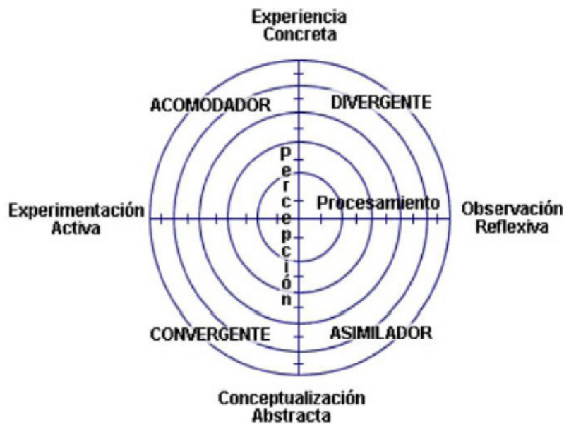
Figura 2. Relación etapas y estilo de aprendizaje a partir de Kolb.

Lo que se espera es que el estudiante haga tránsito por cada una de las cuatro etapas, realizando una espiral del aprendizaje, donde cada una se relaciona con la situación de aprendizaje y con el objetivo de aprendizaje (Jürgens, 2016), en la práctica los alumnos prefieren realizar actividades que se enmarcan en alguno de los cuatro aspectos, prefiriendo acciones de aula que se acoplen con su preferencia y un rechazo por aquellas que no lo son (Rodríguez, 2018). Esta preferencia, y la manera en que la combina con las demás, es la base que lleva a Kolb et al. (1977) a plantear el que existen cuatro estilos de aprendizaje: divergente, asimilador, convergente y acomodador. La Figura 2 muestra la relación entre las etapas y el estilo de aprendizaje.