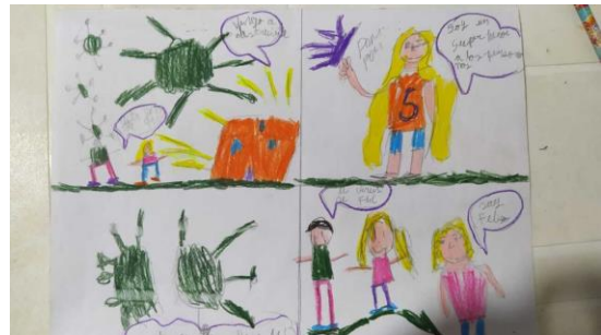
Figura 1. Niña proyectada como héroe de la humanidad al enfrentar.

Asimismo, se busca un acercamiento que permitiera conocer como los preadolescentes han comprendido y percibido la dinámica del confinamiento, refiriéndose a esta desde el uso interactivo de la herramienta del comics, que brinda desde una mirada amplia la forma en que los preadolescentes toman postura frente a la situación del Covid-19 y colocan en manifiesto el sentir propio desde la percepción y lo cambios en cuanto a la socialización.