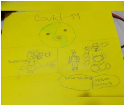
Figura 3. Toma de conciencia de la importancia de cuidado y confinamiento desde casa.

Según Vázquez, (2011) el dibujo como una expresión espontánea, deja de ser objetiva para pasar a ser una expresión emotiva de sentimientos, frustraciones, deseos y miedos de la subjetividad del mundo real y como producto de su imaginación. Esto a su vez, permite generar un reflejo positivista y expresivo que se acapara de las emociones del sentir del confinamiento.