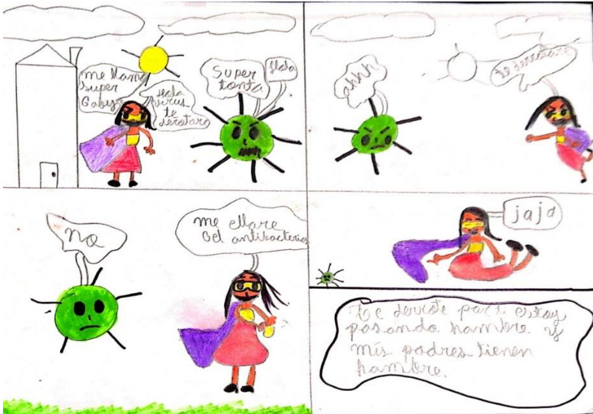
Figura 3 Predomina Representación de las necesidades primarias.